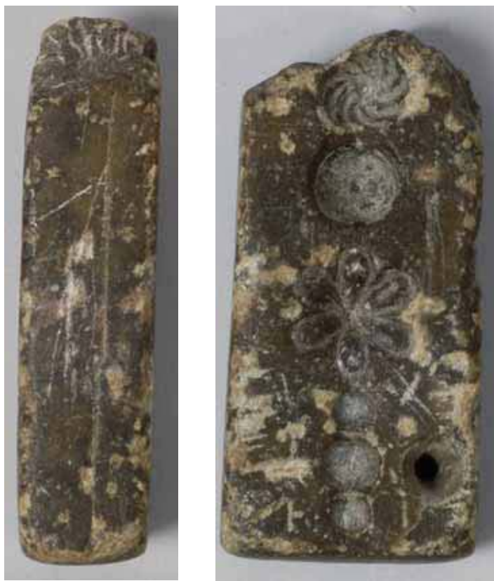
Fig. 1 a-b. Gjutformens ena smal- och breddside. Den är 66 mm hög (förstorade ca 40%).

Bergarten är brunaktig till färgen och kan lätt bearbetas med eggverktyg. Det bör vara fråga om en täljsten, även om färgen avviker från den vanligen förekommande grågröna nyansen. Författaren har