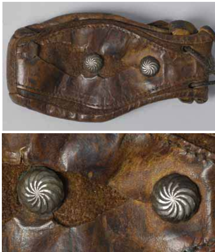
Fig. 4. Silverbeslag med virvelfigur på tobakspung från Täsjö i Ångermanland. Undre fotot visar beslagen i detalj.

tingens inre symboliska betydelse; exempelvis att virvelhjul betecknar solen, uppståndelse och pånyttfödelse, att en ring med flätknut står för ett nära förbund med Jungfru Maria samt att antalet sex symboliserar skapelsedagar, världs- och levnadsåldrar. Ja - vem vet, om inte det sexpassformade beslaget i stället skall uppfattas som en utslagen blomma - en lilja eller ros och i så fall åter en symbol med stark anknytning till Jungfru Maria (Dahlby 1963).