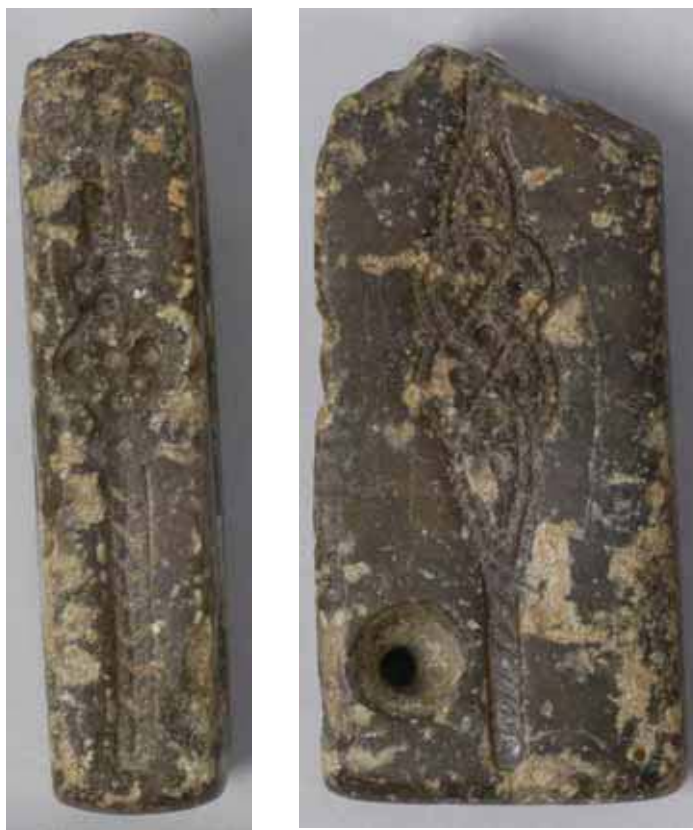
Fig. 1 c-d. Gjutformens andra smal- och breddsida. Den är 66 mm hög (förstorade ca 40%).

Gjutkaviteten finns på formens båda breddsidor och den ena smalsidan. Vidare har det tagits upp ett hål från breddsida till breddsida. I den ena brottytan på kortänden märks en antydning till ytterligare ett hål eller en fördjupning. Formen är avsedd för framställning av två