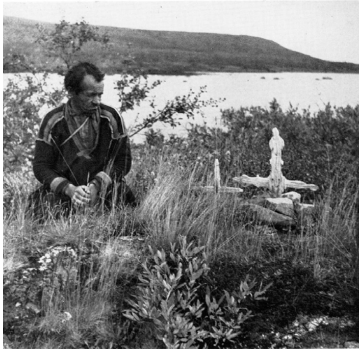
Fig. 4. Antatt urørte sommergraver på Jåbmeksuolo i Råvvtasjåvri i Nord-Sverige (etter Manker 1961).

Bolshoy Oleny ostrov (Store Reinøya) i Kolafjorden, gravfunn fra henholdsvis tidlig metalltid/jernalder på Sjøholmen i Varanger (Solberg 1909:97f, jf Schanche 2000:376), ei grav datert til 1400-tallet på Kirkegårdsøya ved Hammerfest i Finnmark (Svestad 2006a), og det forhold at det finnes både offerplasser og førkristne graver i tilknytning til mange av disse gravstedene. Gravplasser på holmer og øyer synes også å ha stor utbredelse og nylig er det kartlagt flere slike i finske innlandsområder, der mange antas å være samiske (Ruohonen 2002, 2005, pers.medd.). På to slike grav- eller dødsholmer benevnt Kalmosaari (Dødsholmen) i henholdsvis Kangaslampi og Vihtari kommuner relativt langt sør i Finland (Savu distrikt), er det påvist graver