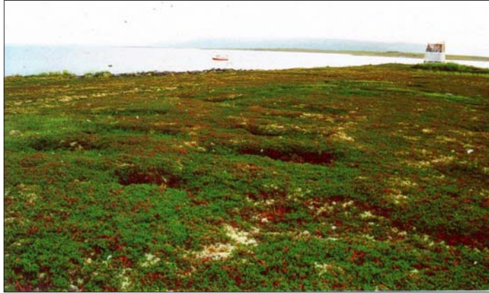
Fig. 3. Sporene etter den kristne gravplassen på Jámešnjarga/Dauingneset, utgravd av medisinerere i 1922.

gravplassen Jámešnjarga (Dauingneset) på Juovvi/Nordre Langøy 10 i Porsanger kommune i Finnmark (Schanche 2000:44, 115; Svestad & Barlindhaug 2003; Holand 2005). Her ligger kristne jordgraver og førkristne urgraver. Gravplassen blei innvidd av en lokal prest på slutten av 1600-tallet og var muligens i bruk til 1759. Det er uklart hvorvidt presten var klar over stedets religiøse forbindelse og gjorde sine grep, men lokaliseringa indikerer likevel forbindelser mellom førkristen og kristen gravskikk. Det er grunn til å påpeke at den første kjente kristne gravplassen i en så vidt stor sjøsamisk region som Porsanger er lagt hit 11 . På 1920-tallet var gravplassen gjenstand for ei antropologisk utgraving. Den viste at de fleste var lagt i pulker og noen i kister 12 . Det blei også gjort andre funn i flere graver, bl.a. rester av klær, tekstiler (fra svøp?), en bronsering, et metallkjede og flere uidentifiserte gjenstander av jern (se også Holck 1991). Ved en tidligere anledning blei det foretatt ei antropologisk utgraving av ei urgrav på øya, og her var den døde lagt i kiste, svøpt i never og medbrakt ting i form av pipe(beslag) og kniv(?) 13 .