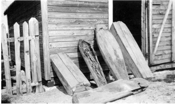
Fig. 5. Kister av uthulte trestammer og "pulklignende" kister fra Kautokeino kirke.

trevirke (gran/furu). Funnene fra Kautokeino kirke inneholdt også bare barneskjeletter, men stedet har derimot ikke naturlig tilgang på stort trevirke. Sistnevnte peker på dette materielle trekkets viktige betydning. Som jeg har vært inne på tidligere, går trekket tilbake til førkristen tid, der det også primært opptrer i sammenheng med barn. Som en digresjon må nevnes at pulk av sørsamisk type er gjort av en uthult trestamme i motsetning til den nordsamiske (pers.medd. Johan Albert Kalstad).