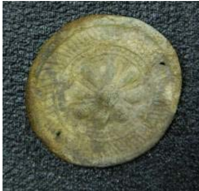
Fig. 6. Metallknapp (25 mm i diam) funnet i grav av nyfødt barn på kirkegården Nuvvus på finsk side av Tanaelva (Utsjoki kommune). AI3441, Anatomisk institutt, UiO.

Det var en prost i Torneå - med en menighet av hedninger. De var døpt og deres ekteskaper kirkelig viet av prester, men allikevel kalles de hedninger. Jeg kan ikke fatte det. (Kvandahl 1932:56)