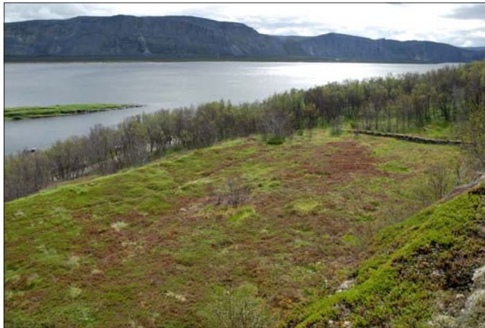
Fig. 2. Gullholmen kirkegård, Deatnu/Tana, Finnmark. Eksempel på førstnevnte type gravplass. Gravene vises som groper/forsenkninger i terrenget. Sommeren 2006 blei det foretatt en arkeologisk undersøkelse av noen graver. Funnene bekrefter tendensen i denne artikkelen.